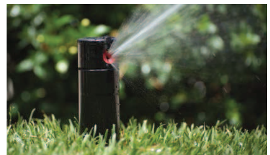
Buse standard PGP

Exemples : PGP-ADJ = Escamotable 10 cm, secteur réglable avec jeu de buses ROUGES PGP-ADJ-B - 3,0 = Escamotable 10 cm, secteur réglable avec jeu de buses BLEUES 3,0 PGP-ADJ - 07 = Escamotable 10cm, secteur réglable avec buse ROUGE #7