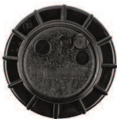
PGP-ADJ Réglage facile du secteur d'arrosage